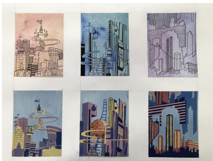
Примеры стилизации архитектуры